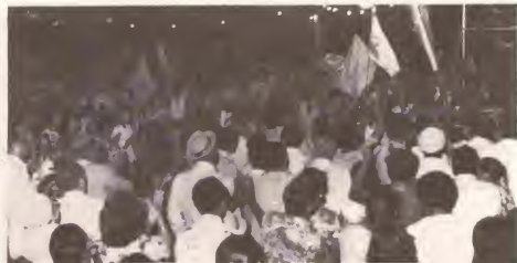
Desicion 1975 a logra di a acumula miles y miles di personanan durante reunionnan pa eleccion di eilandsraad, na 1975.

Cu e lema "Desicion 1975" e partido M.E.P. a gana eleccion di eilandsraad na 1975. Cu 13 asiento M.E.P. a forma e gobierno insular. E mes un anja e gobierno insular a keda forma y a cuminsa traha di biha ariba e preparacionnan pa e independencia di Aruba.